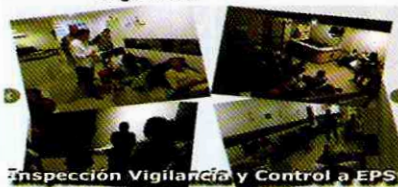
Inspección Vigilancia y Control a EPS

Consolidarse como la dependencia de apoyo y liderazgo en la coordinación y ejecución de las acciones de carácter administrativo y las relaciones con las diferentes dependencias de la administración municipal y la comunidad en general.